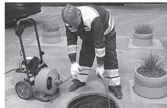
Комунальники опановують новітню техніку

Комунальне підприємство «Керуюча компанія з обслуговування житлового фонду Шевченківського району» модернізує та автоматизує роботи з прочистки каналізаційних мереж.