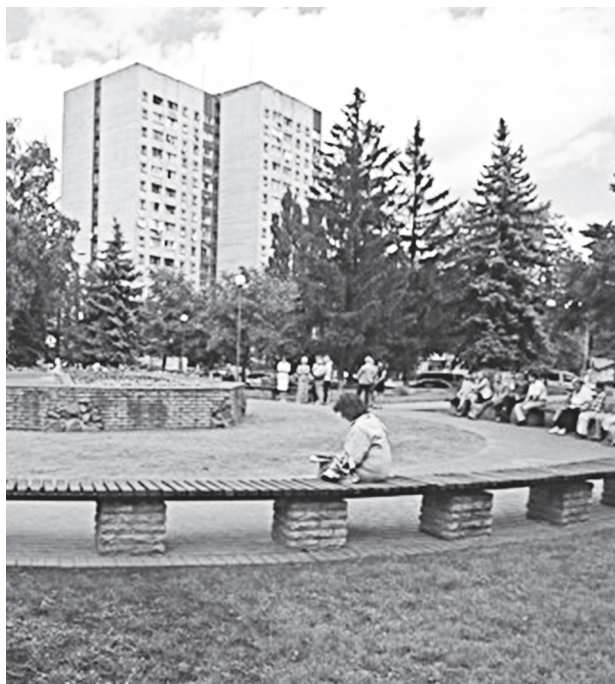
Сквер зажив новим життям

Щоб відновити благоустрій, комунальники прибрали незаконні кіоски, відновили покриття доріжок, замінили тротуарну плитку, повичищали дерева, відремонтували фонтан та поливо-зрошувальну систему, встановили бетонні поребрини та відновили дерев'яні садові дивани. На території скверу було висаджено 4,5 тис. квітів, а найближчим часом планується висадити горобину та саджанці декоративних чагарників. Буде змонтовано звукоізолюючу огорожу, що захищатиме відвідувачів (переважно пенсіонерів і дітей) від пилу та шуму.